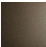
GFM11 goffrato titanio