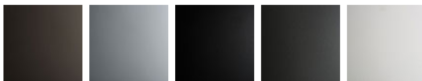
06 cromo nero