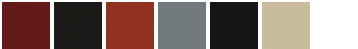
89 ROSSO CORSA 91 TESTA DI MORO 92 LOBSTER 93 ARTICO 95 BLUE OCEANO 97 PANNA