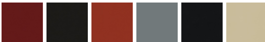
89 ROSSO CORSA