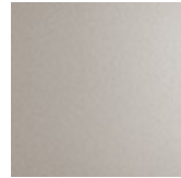
GFM70 goffrato pearl