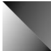
trasparente extrachiario bisellato