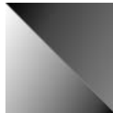
trasparente extrachiaro bisellato