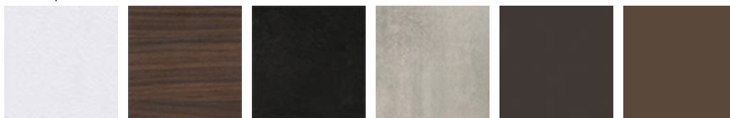
LM02 bianco climb