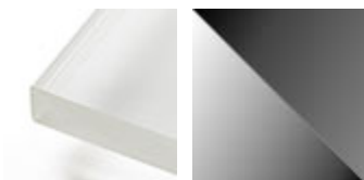
bianco extra chiaro