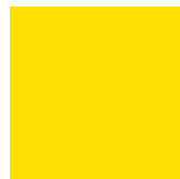
OP66 giallo opaco