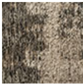
cotone ciniglia Darwin