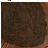
Mdf impiallacciato con sezione di tronco