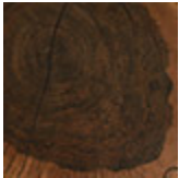
Mdf impiallacciato con sezione di tronco