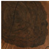
Mdf impiallacciato con sezione di tronco