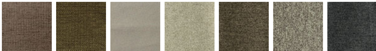
B404 B405 B500 B501 B502 B503 B504