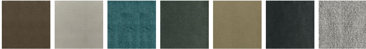
B201 B202 B203 B204 B205 B207 B300