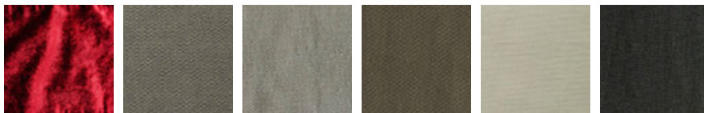
B703 B800 B801 B802 B803 B804