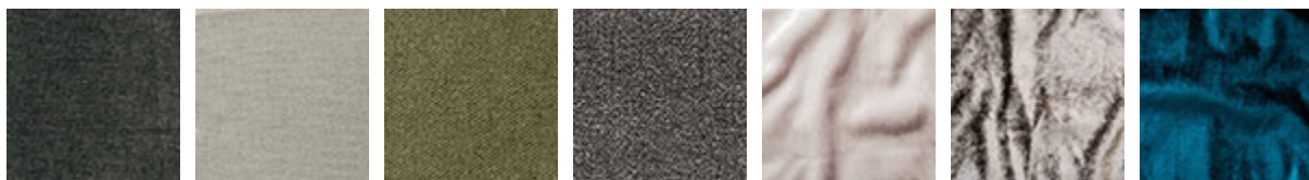
B506 B600 B601 B602 B700 B701 B702