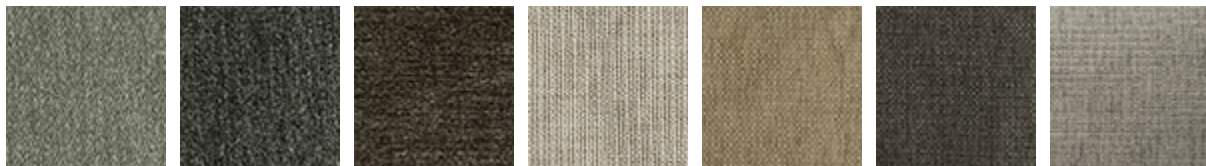
B301 B302 B303 B400 B401 B402 B403