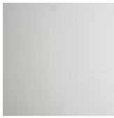
OP71 bianco opaco