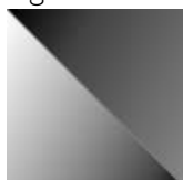
fr73 frassino laccato poro aperto nero