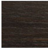
RB rovere bruciato