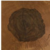
sezione di tronco di rovere