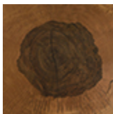
seziione di tronco di rovere