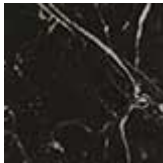
NM nero Marquina lucido