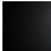
OP17 nero opaco