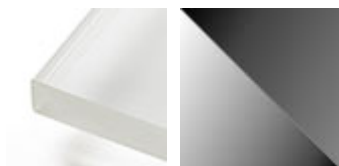
bianco extra chiaro