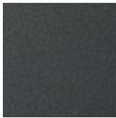
GF69 goffrato graphite