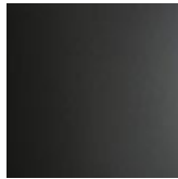
OP69 graphite opaco