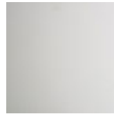
OP71 bianco opaco