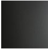
OP69 graphite opaco