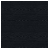
fr73 frassino laccato poro aperto nero