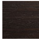
frRB frassino tinto rovere bruciato