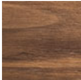
NC noce canaletto