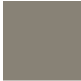
OP30 grey opaco