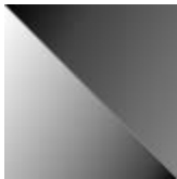
graphite extra chiaro