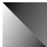
graphite extra chiaro