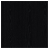
fr73 frassino laccato poro aperto nero