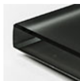
nero extra chiaro acidato