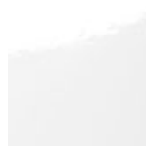
L7 laccato bianco lucido