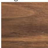
NC noce canaletto