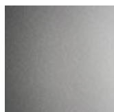
14 silber met