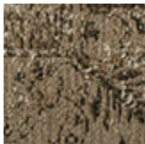
cotone cimiglia Delhi