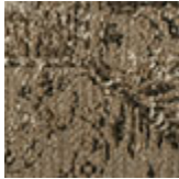
cotone cimiglia Delhi