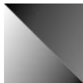
trasparente extrachiario bisellato