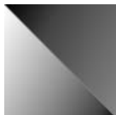
trasparente extrachiaro bisellato