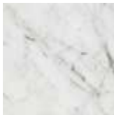
BCO bianco Carrara opaco