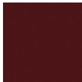
ECP13 ROSSO CORSA