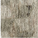
cotone cimiglia nero Rubik