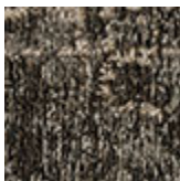
cotone ciniglia Mapoon