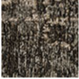
cotone ciriglià Mapoon