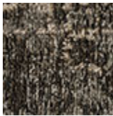
cotone ciniglia Mapoon