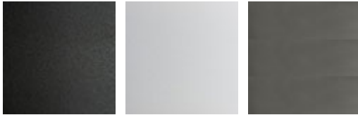
GFM69 goffrato graphite