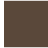
LM22 castoro Ottawa Fenix