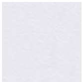
LM02 bianco climb