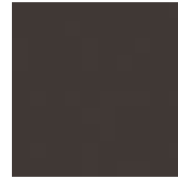
LM21 grigio Londra Fenix