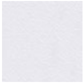
LM02 bianco climb