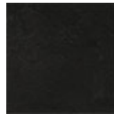
LM06 ossido grigio