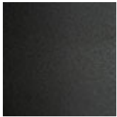
GFM69 goffrato graphite